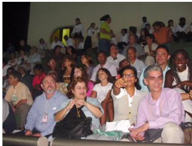
MARTES 26 DE OCTUBRE. Espectáculo recreativo educativo con Delfines. Delfinario del Acuario Nacional de Cuba