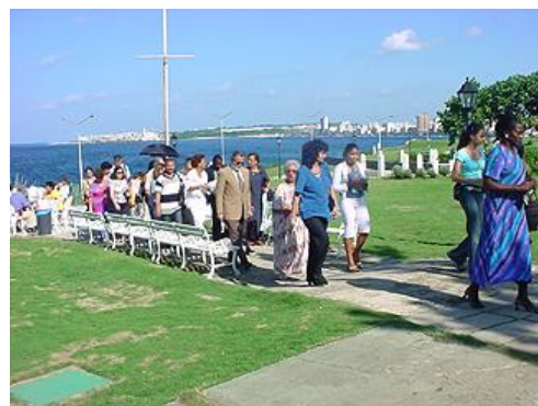
MIÉRCOLES 27 DE OCTUBRE. Recorrido histórico por el Hotel Nacional de Cuba. Inicio en el lobby del Hotel Nacional