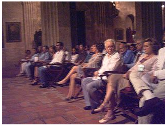
Gala en la sala de conciertos de San Francisco de Asís, La Habana Vieja